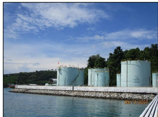
พื้นที่ปฏิบัติการ