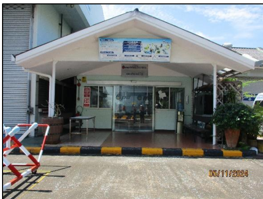
อาคารสำนักงานแผนกบริการขายและบริหารงานทั่วไป