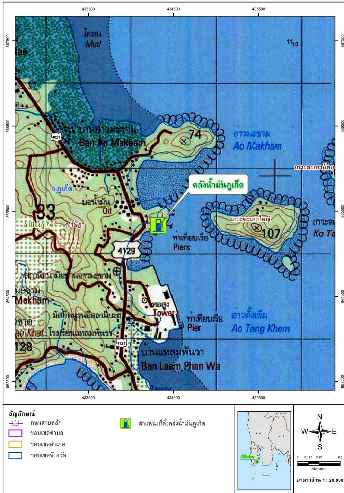
รูปที่ 1.1-1 ตำแหน่งที่ตั้งโครงการทำเทียบเรือและคลังน้ำมันภูเก็ต