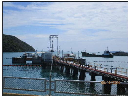
ท่าเทียบเรือ