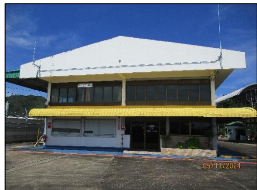
อาคารสำนักงานแผนกปฏิบัติการน้ำมัน