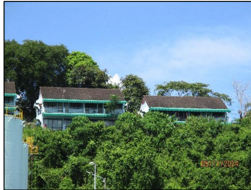
บ้านพักพนักงาน